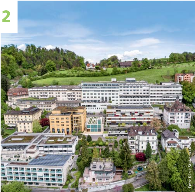
Trend: Das im Rahmen des «Lean Healthcare Award 2017» prämierte Team der Klinik St. Anna Luzern stellt sein Projekt vor.